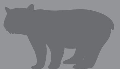
สัตว์ขนาดใหญ่