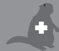
สัตว์ตัดเชื้อ