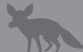
สัตว์ดุร้าย