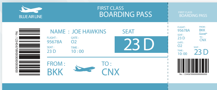
Boarding Pass (บอร์ดถึงพาส) แบบพิมพ์

เมื่อคุณเช็คอินแล้ว จะได้รับเอกสารที่อนุญาตให้ผ่านไปขึ้นเครื่องบินได้ ซึ่งเรียกว่า Boarding Pass หรือ E-Boarding Pass ที่มีข้อมูล เช่น หมายเลขประตูทางออกขึ้นเครื่อง เวลาขึ้นเครื่อง (Boarding Time) และหมายเลขที่นั่ง