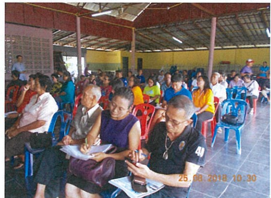
ภาพบรรยากาศระหว่างการประชุม