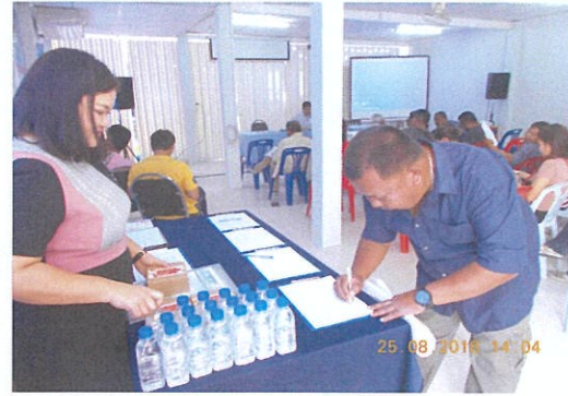
ภาพบรรยากาศการลงทะเบียนผู้เข้าร่วมประชุม