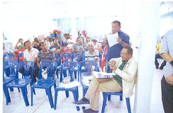
ภาพบรรยากาศการแสดงความคิดเห็นและซักถาม

รูปที่ 3 ภาพกิจกรรมการประชุมกลุ่มย่อย วันเสาร์ที่ 25 สิงหาคม 2561 เวลา 14.00-16.00 น.