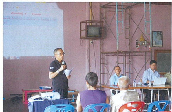
ภาพบรรยากาศการแสดงความคิดเห็นและซักถาม

รูปที่ 2 ภาพกิจกรรมการประชุมกลุ่มย่อย วันเสาร์ที่ 25 สิงหาคม 2561 เวลา 10.00-12.00 น. ณ อาคารอเนกประสงค์ ชุมชนวัดบางรักษ์ ตำบลบ่อผุด อำเภอเกาะสมุย จังหวัดสุราษฎร์ธานี