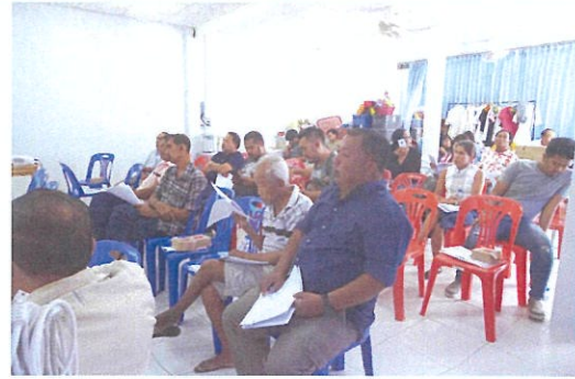
ภาพบรรยากาศระหว่างการประชุม