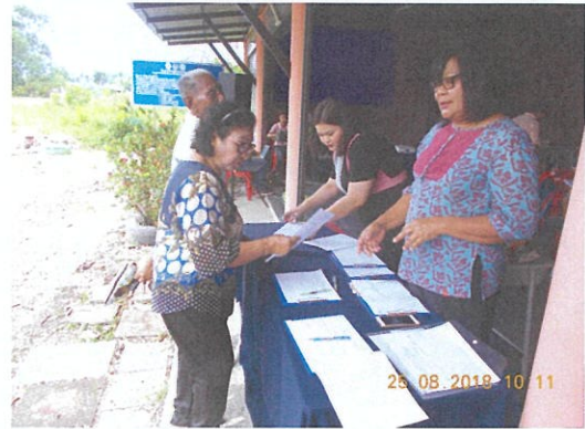
ภาพบรรยากาศการลงทะเบียนผู้เข้าร่วมประชุม