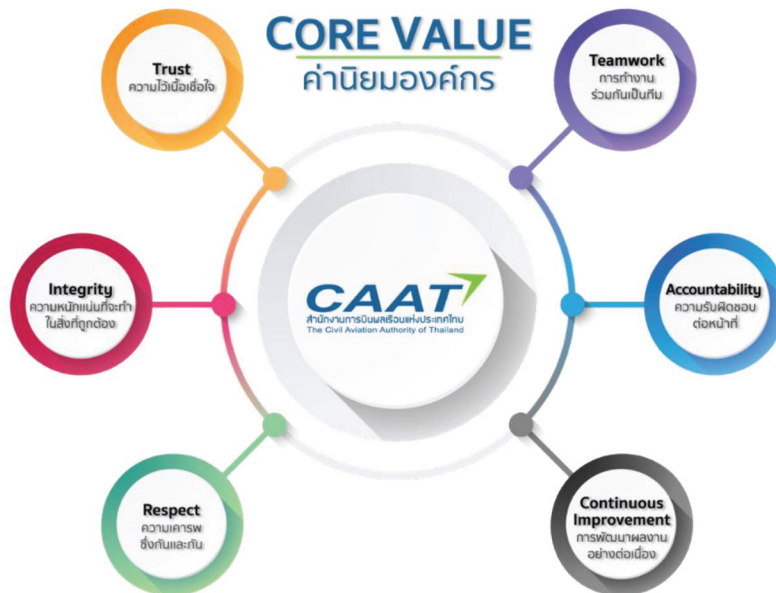
รูปที่ 2 ค่านิยมองค์กร

“Continuous Improvement” การพัฒนาผลงานอย่างต่อเนื่อง